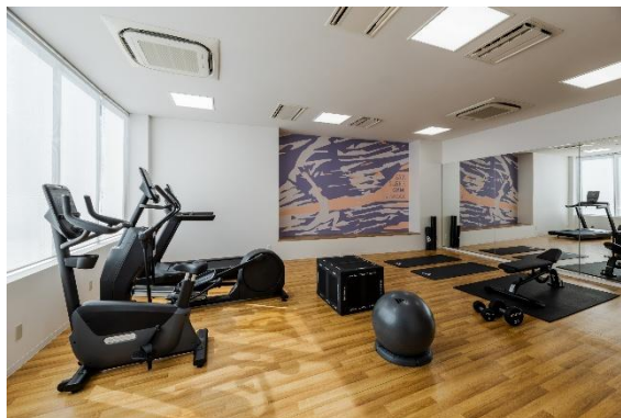
(右)フィットネスセンター

「ヒルトン・ガーデン・イン横浜みなとみらい」の詳細は https://hiltongardeninn-yokohama.hiltonjapan.co.jp/ をご覧ください。