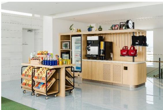
(左)&To Go(アンド・トゥー・ゴー)

スナックやスイーツ、ドリンクなどを揃えた「&To Go」と、フィットネスセンターやコインランドリーは、いずれも 24 時間いつでもご利用いただけます。ホテル内で、横浜ならではの土産や軽食の購入から、ウェルネスや身の回りのケアまで、滞在中のさまざまなニーズにお応えします。