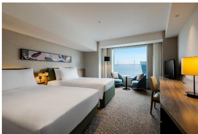
ツインデラックス ファミリールーム(上層階)