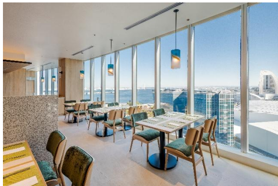
19階オールデイダイニング「Together & Co.」

スナックやスイーツ、ドリンクなどを揃えた「&To Go」と、フィットネスセンターやコインランドリーは、いずれも 24 時間いつでもご利用いただけます。ホテル内で、横浜ならではの土産や軽食の購入から、ウェルネスや身の回りのケアまで、滞在中のさまざまなニーズにお応えします。