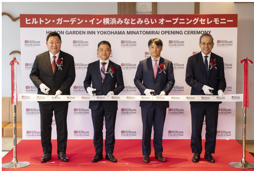
開業セレモニーでのテープカット(左から)

三菱HCキャピタルリアルティ株式会社(本社:東京都千代田区、代表取締役社長 若尾 逸男)とヒルトン(本社:米国バージニア州、取締役社長 兼 最高経営責任者:クリストファ J. ナセッタ)は、「ヒルトン・ガーデン・イン横浜みなとみらい」を本日 2026年4月7日(火)に開業したことをお知らせいたします。「ヒルトン・ガーデン・イン横浜みなとみらい」は、「ヒルトン・ガーデン・イン」ブランドとして国内で 2 軒目 1 、関東では初進出のブランドで、ヒルトンにとっては横浜市内で 2 軒目 2 のホテルとなります。