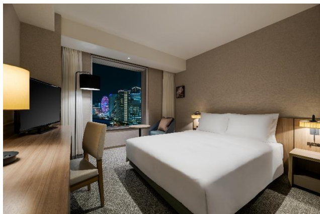
クイーンゲストルーム(オーシャンビュー・上層階)