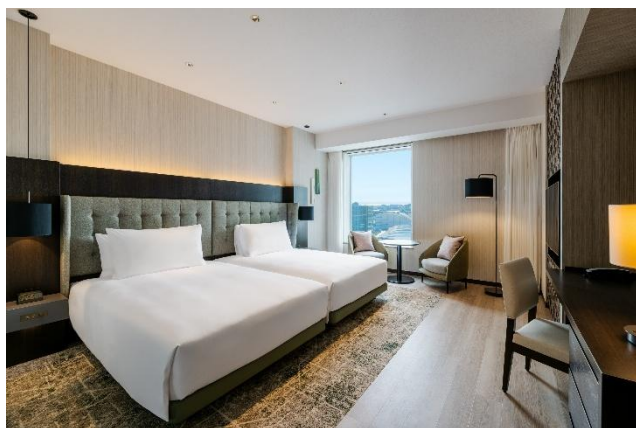
ツインプレミアムルーム(オーシャンビュー)

客室は、21 平米のゲストルームから 27~34 平米のデラックスルーム、44 平米のツインプレミアムルームまで、全 13 種類をご用意しています。ビジネスや一人旅から、ご家族・ご友人とのご滞在まで、快適な空間をご提供いたします。