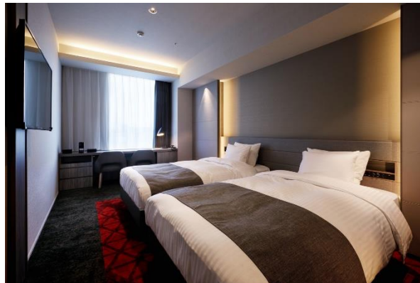
<スーペリアツイン／28 m 2 >