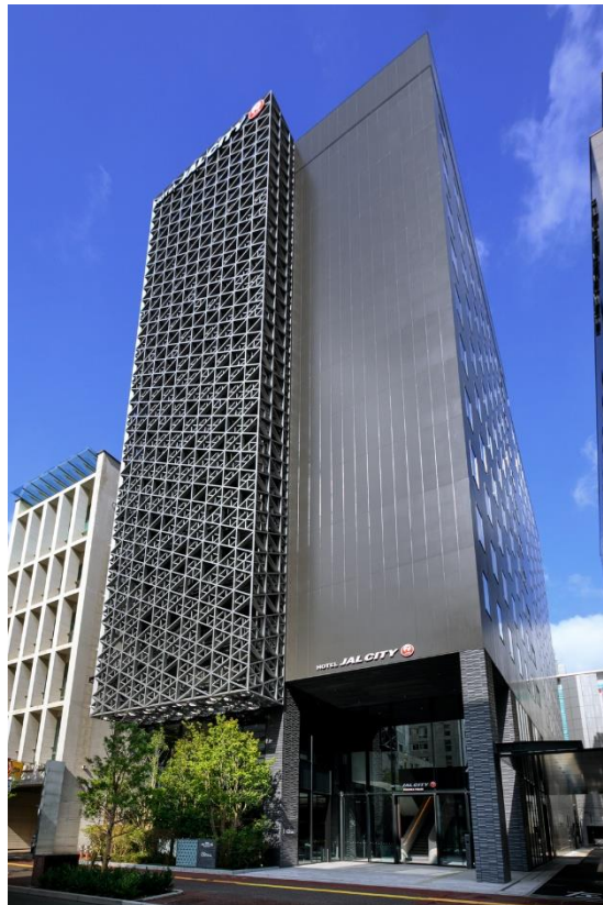
〈『ホテルJALシティ福岡 天神』外観写真〉

MURIは、本ホテルへの投資に留まらず、経営会社として事業参画することで、本ホテルを所有するSPCのアセットマネージャーであるInvesco およびホテル運営受託者であるONHMと共同で、事業価値の最大化を目指すとともに、地域の一層の発展と活性化に貢献してまいります。